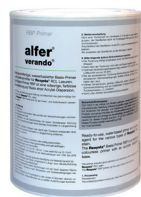
42507 Primer neutral, 1,0 l Nur zur Vorbehandlung für die anschließende Lasur.